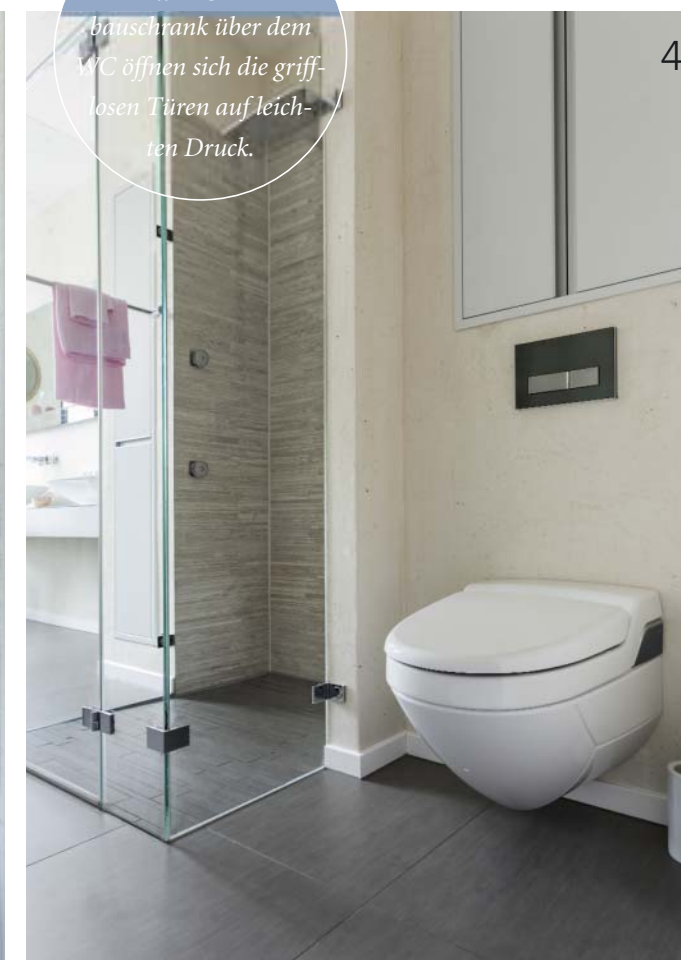
Adressen am Heftende