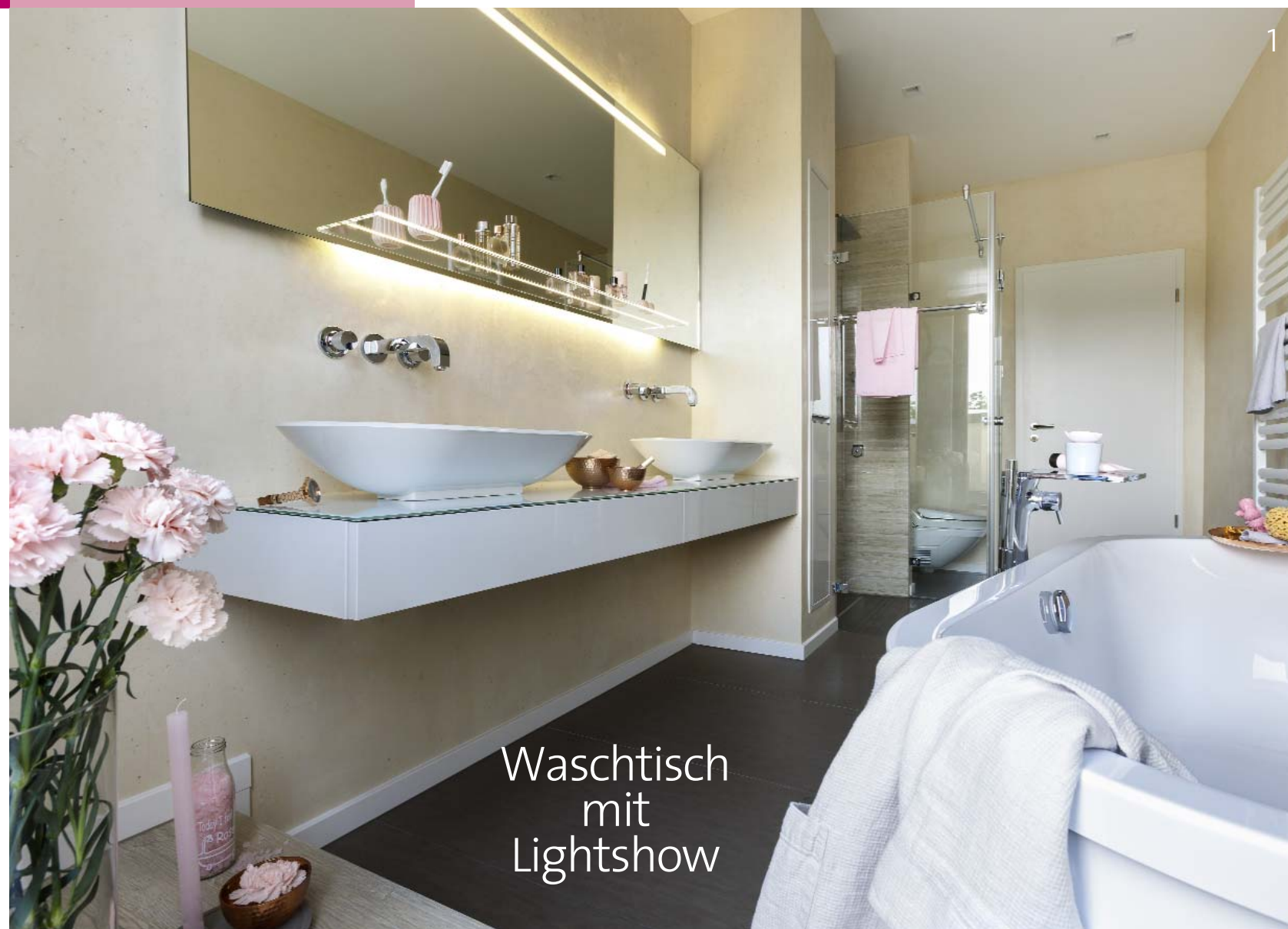
Waschtisch mit Lightshow

B ernd Fink beginnt sofort zu schwärmen: „Wir genießen aus unserem Bad einen traumhaften Blick aufs Ruhrtal, schon das ist Erholung pur.“ Er und seine Frau Waltraud haben ihr Haus im Grünen gegen eine Penthouse-Wohnung in der Stadt eingetauscht und das Badezimmer nicht nach den Plänen des Bauträgers, sondern nach eigenen Vorstellungen mit einer Innenarchitektin realisiert. „Wir wollten ein bodentiefes Fenster mit Zutritt zur Terrasse, eine frei stehende Wanne, eine große Dusche und ein stimmiges Lichtkonzept.“ Im lang gestreckten Bad – rund 5,25 x 2,45 m – steht die Wanne schräg vor einem Podest, beides lockert auf und verkürzt den Raum optisch. Tageslicht satt bekommt der Doppelwaschtisch. Die bodenebene Dusche ragt in den Raum und verdeckt gleichzeitig das Dusch-WC. „Der Verzicht aufs Bidet ließ uns mehr Gestaltungsspielraum“, erklärt der